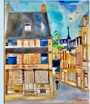
Illustration Emmanuel Blouin

Pour cette première édition, 18 nouvelles ont été reçues.